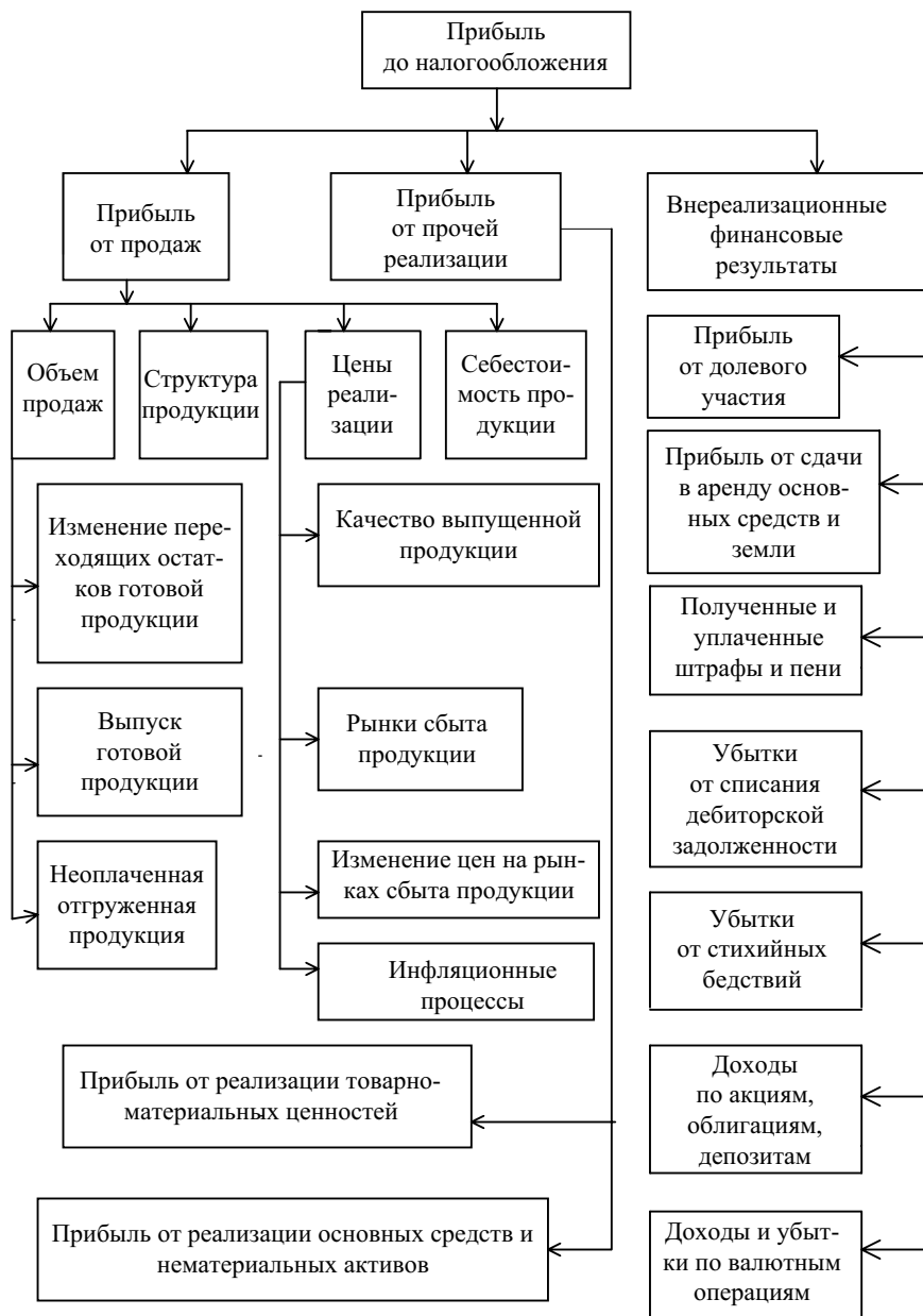
Схема 1. Факторный анализ прибыли до налогообложения