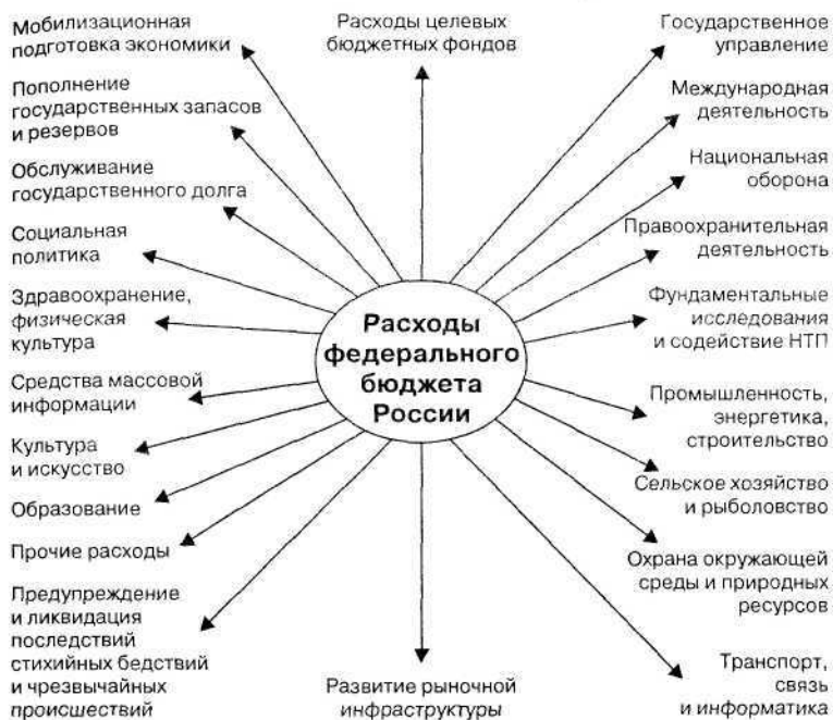
Рис.1. Расходы федерального бюджета (основные направления)